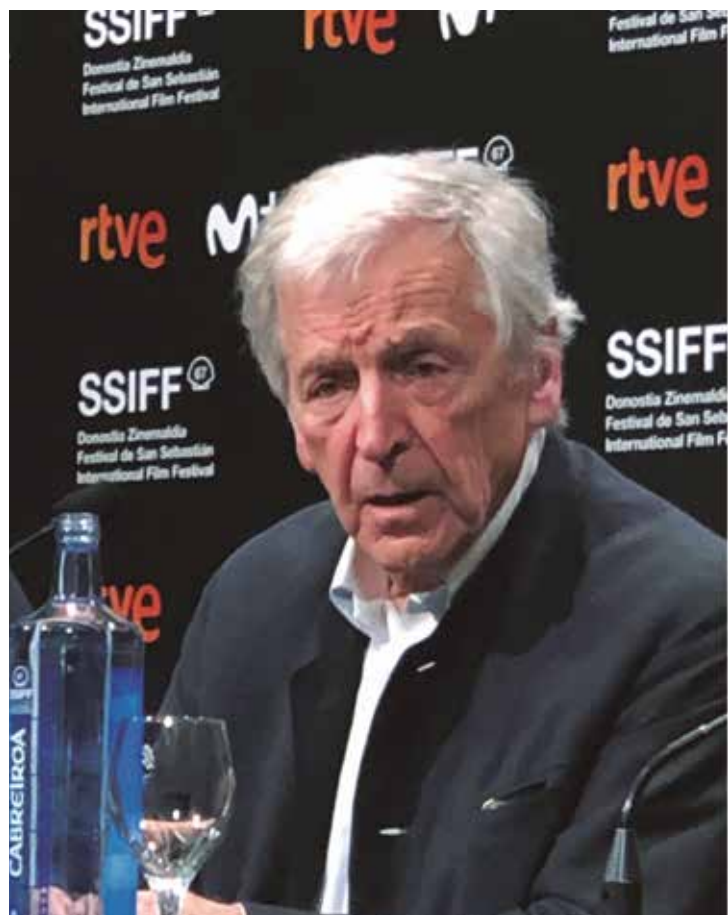
El director Costa-Gavras, entrevistado por Trasluchada.

Tema municipal. Al cine Principal, es una propuesta, no podrían arreglarle los asientos ¿y al Victoria Eugenia, colocarle los focos de forma que no obstaculicen la proyección?