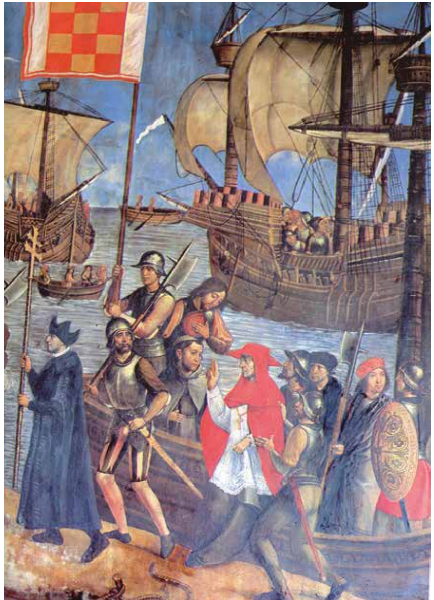
Fresco de Juan de Borgoña (1514). Cisneros en Orán, Elcano participarian con su nao en aquellos combates. Al fondo detalle de nao de alto porte

Carecía de conocimientos de física e historia natural. Es cierto que trabajó todo lo posible para reflejar lo que había visto. Pero carecía del filtro, que permite diferenciar la leyenda de la realidad. Su original se puede clasificar como escrito para complacer al público, con historias y leyendas extraordinarias, que solían ser inevitables, en los relatos de lugares inexplorados: en la Biblia se cita y desarrollan historias sobre los gigantes, si creemos a Pigafetta, él los conoció. Es evidente que su relato de la “Vuelta al Mundo” (así como los de Gonzalo Fernández de Oviedo o Pedro Martín de Anglería) fueron más atrayentes para los lectores, que el austero texto de Elcano, cito un pequeño detalle, el de su misiva a Carlos I “ Mas sabrá su Alta Majestad lo que en más avemos de estimar y temer es que hemos descubierto e redondeado toda la redondez del