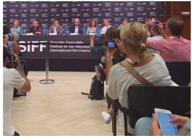
Rueda de prensa de Alejandro Amenábar y equipo.

En su trabajo El Capital, reflejó maravillosamente bien "la ambición". En Comportarse como adultos, plasma la humillación y la venganza del rico. Así como El Capital era un film dinámico, este solo es recomendable para personas interesadas, y con algún conocimiento de economía. Se ha ceñido demasiado al libro de Varoufakis.