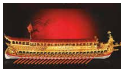
Fig. 3 Maqueta del Bucintoro, galera del dux de Venecia.

fico, con una eslora de unos 35 metros y cubierto todo él de oro. Pero, lamentablemente, esta bellísima y lujosa galera fue destruida en 1798 por orden de Napoleón Bonaparte, una vez saqueada. (Fig. 3)