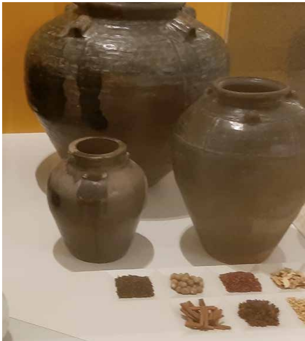
Especies y envases para su transporte. Museo Naval Lisboa. Fotografía: Yolanda de Apraiz.

Solo les quedan tres embarcaciones, la Sta. Cruz se había destruido en los acantilados, la San Antonio (144 toneladas y una tripulación de 57 hombres), la de mayor capacidad de la expedición, es tomada por el portugués Esteban Gómez (parece bastante probable que fue el descubridor de la Malvinas), se había mantenido fiel a Maga-