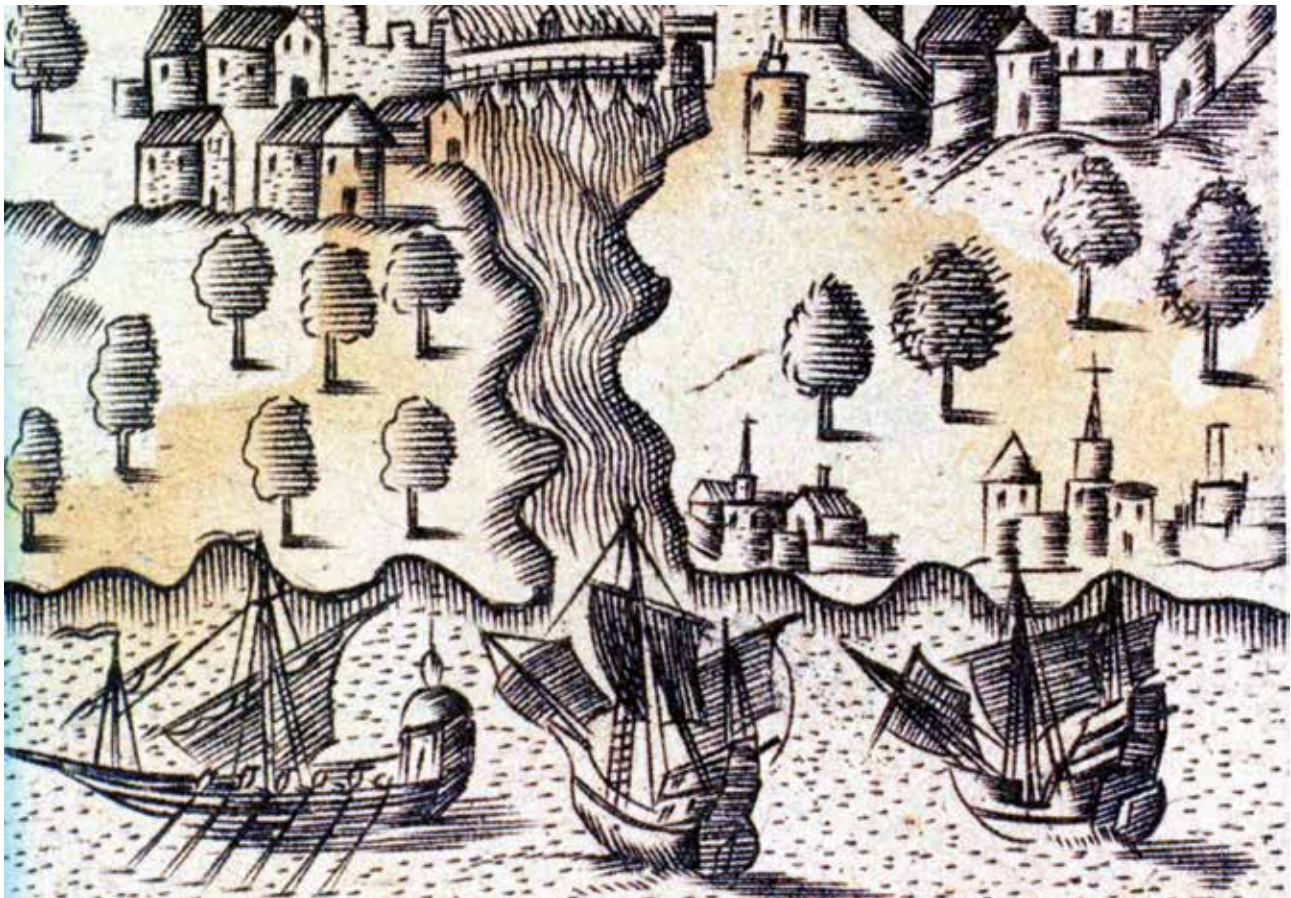
La nave Victoria embocando el Gualdiquivir. Madrid 1601

copia de su "diario" a Carlos I), se presenta ante Juan de Portugal, para relatarle todo el viaje. Es decir al rey que había mandado una flota para detenerles, al que el emperador Carlos I quiere arrebatarse el monopolio del comercio de la especies.