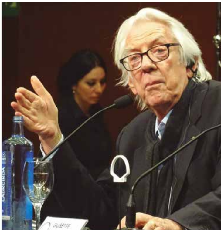
Donald Sutherland, premio Donostia.