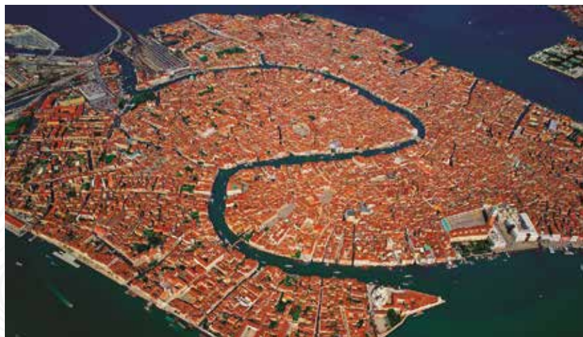
Fig. 1 Vista aérea de Venecia.

Llegados a este punto, se plantea una cuestión muy interesante: ¿cómo pudieron los venecianos construir esta ciudad, sus casas, sobre el mar? Para ello utilizaron palafitos o estacas de madera de roble o de alerce y que, debido a la escasez de arbolado de la zona, procedían por vía marítima de Croacia o Montenegro. Estas estacas se clavaban bajo el agua sobre los fondos arenosos y constituyen un auténtico bosque de pilares sumergidos sobre los que construyeron la ciudad. Sobre las estacas, colocaban plataformas de madera cubiertas por capas de bloques de piedra sobre las que levantaron sus edificios: casas, palacios, iglesias. Al contrario de lo que se podría pensar sobre la aparente fragilidad de la conservación de estas estacas de madera bajo el agua, éstas no llegan a pudrirse por la falta de oxígeno en las capas profundas y, al permanecer en contacto con el agua, van adquiriendo, en el transcurso de los años, una consistencia pétreo que las hace muy resistentes.