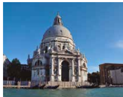
Fig. 2 Santa Maria della Salute, 1631- 1687.

Quiero finalizar mencionando una de las tradiciones más originales e insólitas que se celebraban en la ciudad del Adriático y que confirma la estrecha vinculación de Venecia con el mar que, a fin de cuentas, era el que había aportado a sus habitantes su razón de ser, su idiosincrasia y su riqueza. Se trata de la fiesta de los esponsales de la Serenísima República con el mar (Sposalizio del Mare), unión simbólica que se venía celebrando desde el año 1000, el día de la Ascensión, instituida por el dux Pietro II Orseolo. El dux poseía un barco, una gran galera espectacular llamada Bucintoro o Bucintoro (buzino d'oro, buque de oro) y en ella salía al mar vestido con su más lujosa indumentaria: manto púrpura con piel de armiño y el sombrero, llamado corno. En un momento dado, arrojaba desde el precioso barco a las aguas del Adriático, su anillo de oro como símbolo de estos esponsales mientras decía: «Desposamus te, mare, in signum veri perpetuique domini, ("Te desposamos, mar, como signo de dominación perpetua")». El Bucintoro llegó a su máximo esplendor en 1729 cuando fue construido el último y más magní-