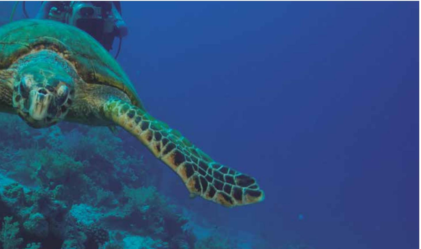
Tortuga boba en el Mar Rojo.

dejemos que la tortuga esté lo más cómoda posible y que nadie se sitúe delante de ella. El desove dura más de una hora desde que la tortuga sale del agua hasta que regresa al mar.