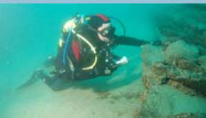
Urpeko Jardueren Atala