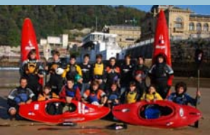
Piraguismo Eskola 2008/09

ekarritako gizarte mailak eta baita kirol mailak erakarrita bailandrak etortzen ziren.