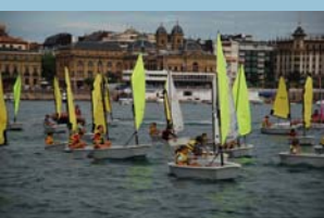
Optimist Hastapeneko Estropada