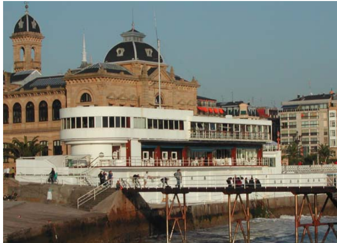
Donostiako Klub Nautikoaren gaur egungo bista Donostiako Portutik

Corbusier-ren Villa Savoye baino lehenagokoa da, bere momentuan, hirian inpaktu handia izan zelarik. Bederatzi hilabete besterik ez zituzten eraikitzeko behar izan, eta 1929an, inauguratu berritan, argitaratuta agertzen da, batzuetan ekintza bereizi bezala eta beste batzuetan aldiz, zerbait zakarragoan parte bezala. Une honetan zutik dirauen mugimendu arrazionalistaren adibide hobereenetakoa dugu.